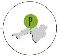
PROSECCO DOCG ZONE